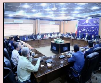
شرکت در جلسه شورای راهبری تصادفات استان