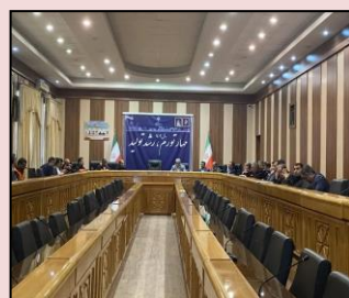
شرکت در جلسه شورای ترافیک استان