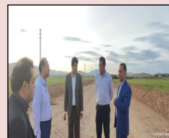
بازدید از موقعیت زمین احداث مرکز داده جنوب کشور