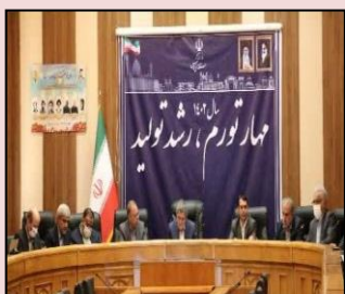
شرکت در جلسه شورای برنامه ریزی و توسعه استان فارس