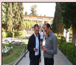
بررسی میدانی وضعیت ارتباطات سیار در اماکن گردشگری شیراز (نوروز ۱۴۰۲)